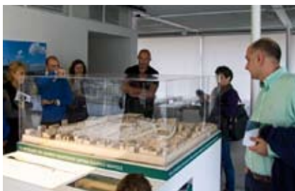
Επίσκεψη ΤΕΕ/ΤΑΣ στο Κέντρο Πολιτισμού Ίδρυμα Σταύρος Νιάρχος

Γ' αυτό και κάθε δραστηριότητά μας, σε αυτό το διάστημα που είχαμε την ευθύνη του ΤΕΕ/ΤΑΣ, κάθε προσπάθεια που κάναμε, είχε έναν και μόνο στόχο: Να δυναμώσουμε τον κλάδο μας και τους ανθρώπους του, μέσα σε αυτή την τόσο σκληρή περίοδο που ζούμε. Αυτό θέλουμε να συνεχίσουμε να κάνουμε.