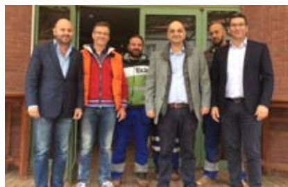
Συνάντηση στελεχών της εταιρείας «Ευρωπαϊκοί Βωξίτες Α.Ε.» με τον Πρόεδρο του ΤΕΕ κ. Γιώργο Στασινό και τον Πρόεδρο του ΤΕΕ/ΤΑΣ κ. Θανάση Λυκόπουλο