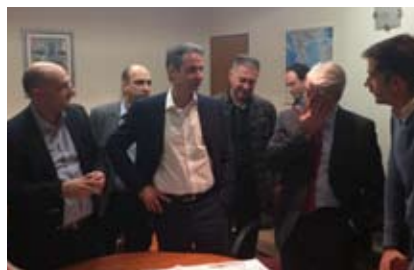
Ο Πρόεδρος του ΤΕΕ/ΤΑΣ κ. Θανάσης Λυκόπουλος με τον Αρχηγό της Αξιωματικής Αντιπολίτευσης κ. Κυριάκο Μητσοτάκη και τον Περιφερειάρχη Στερεάς Ελλάδας κ. Κώστα Μπακογιάννη, στα γραφεία του ΤΕΕ/ΤΑΣ