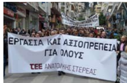
Κινητοποίηση ΤΕΕ/ΤΑΣ για το ασφαλιστικό, στη Λαμία