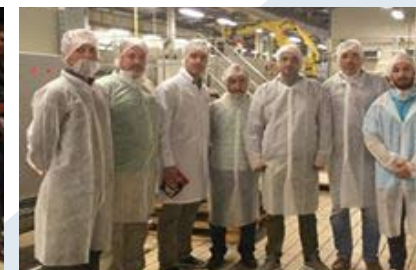
Επίσκεψη ΤΕΕ/ΤΑΣ στο εργοστάσιο της Chrita, στη ΒΙ.Π.Ε. Λαμίας