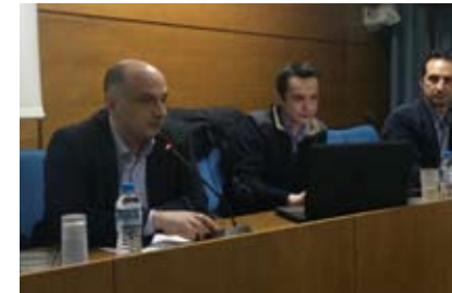
Εκδήλωση για την ενημέρωση μηχανικών, για προγράμματα ΕΣΠΑ, στη Λιβαδειά